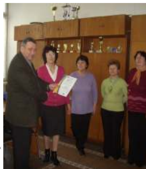
Директорът приема изпратения от София сертификат - признание за отлично справяне с дейностите по проекта